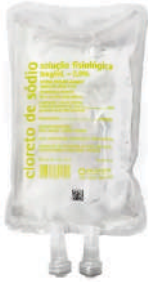
SORO FISIOLÓGICO 0,9% -1 LITRO BOLSA- HALEXISTAR(CX C/15UNID)