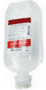
VOLUVEN 6% HIDROXIETILAMI DO FRASCO - 500ML