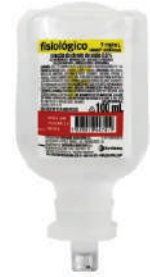
SORO FISIOLÓGICO 0,9% 100ML EUROFARMA(CX C/100UNID)