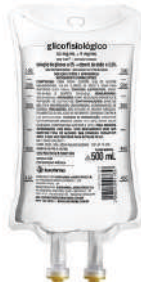
SORO GLICOFISIOLÓGICO 5% BOLSA - 500ML