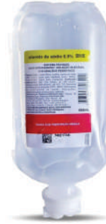
FR SORO FISIOLÓGICO 0,9%